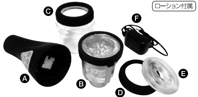
A コントローラー(洗浄不可) B インナーカップ C アウターカップ D スペーサーリング E フロントリング F 充電用ACアダプター